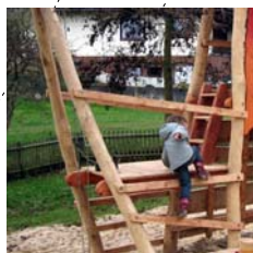
Turm mit Sandaufzug